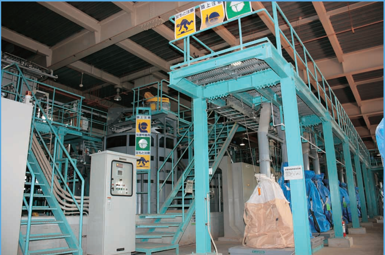
リン回収施設全景