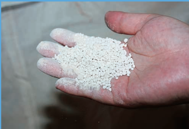
岐阜の大地 白色で無臭

リン酸を取り出し、カルシウム（消石灰）と結合。洗浄・濃縮・乾燥・造粒の工程を経て、植物への効き目が緩やかなリン酸カルシウム肥料「岐阜の大地」として生まれ変わります。さらに処理灰は建設資材として販売、有効利用を図っています。