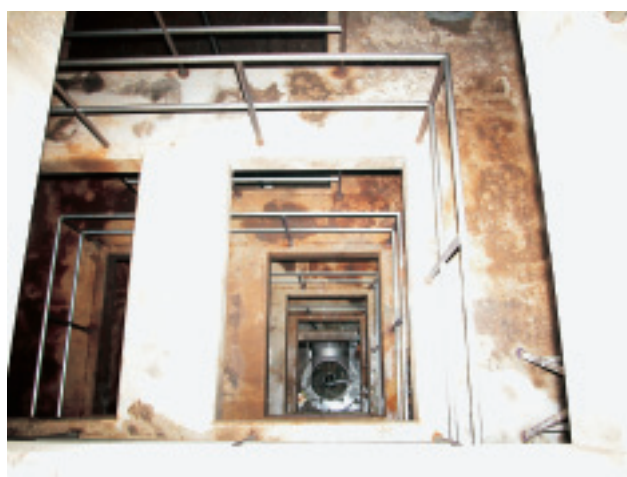
マンホールの上階から見たドロップシャフト

長野県ではこの問題を解決するため、下水道機構と共同で「らせん案内路式ドロップシャフト」の研究を行い、平成8年からこれまでに長野県内だけで100カ所以上で設置を完了しています。そこで、今回のユーザーレポートは、設置から10年以上が経過したこの新技術の現状を長野県千曲川流域下水道建設事務所と(財)長野県下水道公社にお聞きしました。