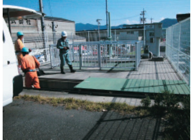
このマンホールは千曲川幹線の右岸河川ゲートも兼ねている