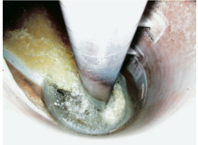
下水が回転しながら流れていくのがわかる

ドロップシャフトの研究は、当初上流処理区の中の千曲川を越える部分で管路に高落差が生じる箇所があり、その対策を目的に平成6年度から下水道新技術推進機構との共同研究としてスタートしました。