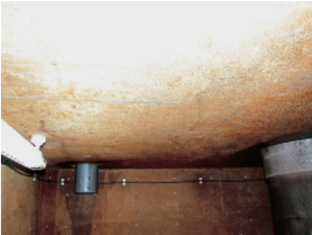
天井には汚れが付着していたが、壁の腐食などは見られなかった

す。マンホール内に設けたドロップシャフトで全流量を流下させているので、汚物の飛散、コンクリートの劣化、硫化水素の発生量が少なく、作業環境は以前に比べ大きく改善されています。今のところドロップシャフトに起因する大きなトラブルなどは発生していません。もちろん単純な挟雑物の詰まりなどがありますが、通常の管渠やマンホールでも発生するようなことです。特に心配はありません。