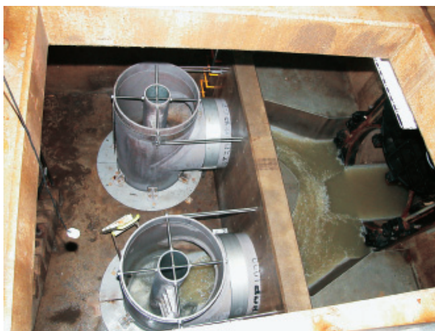
φ1,000mm、落差4.2mのものが二つ並んで設置されている