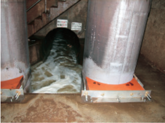
溜まった下水が幹線をゆっくりと流れていく