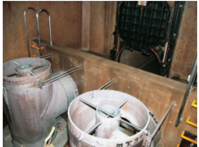
据え付け金具や接合部にも腐食などは見られない

平成7年度までは模型による水理実験などを入念に行い、流入方式の検討や側方流入の場合の管の位置や連結方法、管内部に取り付けるらせん案内路の構造・設置位置などを決定しました。この間、当時の建設省から「新技術活用モデル事業」の採択をいただきました。