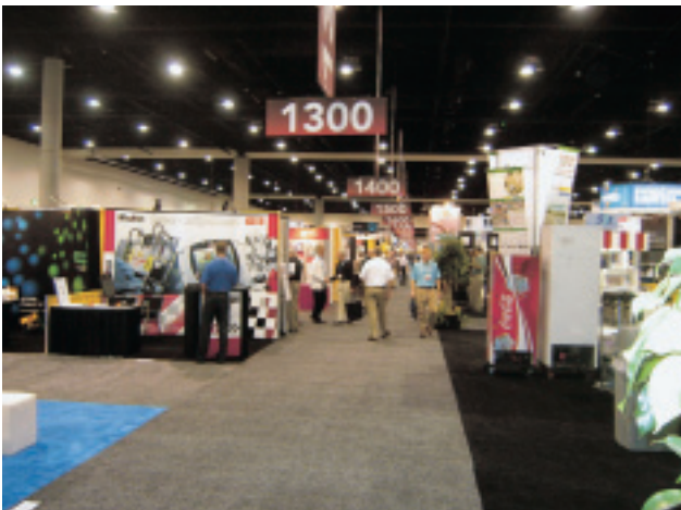
展示会（3900番まで続く）

今回の出張で、下水道を含んだ水環境の分野に係る技術者とのコミュニケーションを通じ、彼らの技術や取組みについて触れることができ、また日米の社会資本に関する捉え方の違いを感じることができました。