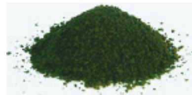
図-2 発熱量比較と製品

脱水汚泥に蒸気を直接供給し、連続的に改質反応（水熱反応：細胞膜を破壊することで疎水化する）を行うことで減容する。改質条件は、加水分解が支配的な領域である200℃-1.6 MPa ~ 230℃-2.8 MPaとする。液状化した改質汚泥（改質スラリー）は冷却器において熱媒と熱交換させる。回収した熱量は製品の乾燥に利用し、エネルギーの有効利用を行う。また、本研究では製品の保管・輸送の際の安全性、運用に関わる費用評価および燃料製品の市場性に関する検討を行う。