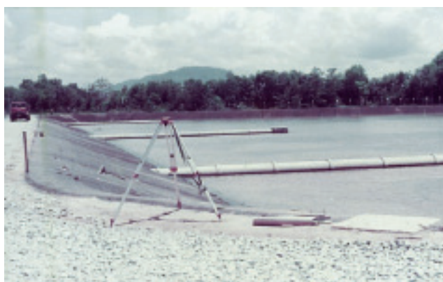
マレーシア バターワース 処理場（安定化池）建設中（1984年）