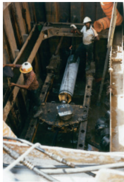
マレーシア バターワース アイアンモール工法による推進（1983年）

今後は、植民地時代に建設された大都市における下水道施設の老朽化対策や処理施設の建設（海洋投棄も多い）が必要になると考えられる。さらに、急激な市