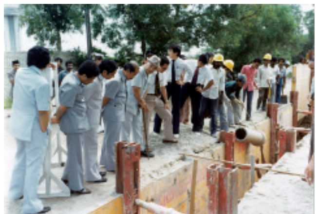
マレーシア バターワース 下水道工事現場をペナン州知事が視察 （クリングス法による開削、1982年）