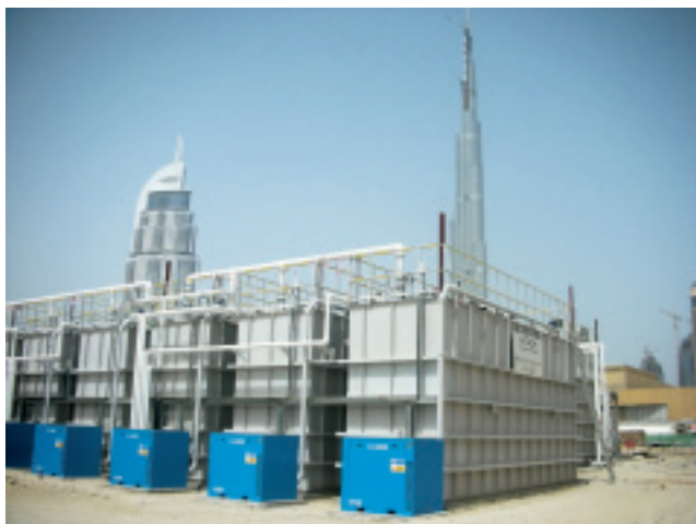
図 ブルジ・ドバイ用再生水製造設備