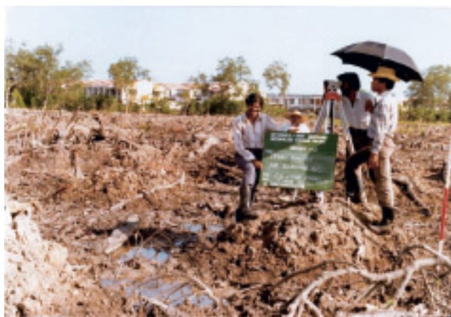
マレーシア バターワース 処理場用地測量（1982年）