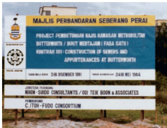
マレーシア バターワースにおける 下水道管渠工事のサインボード（1981年）

いずれにしろ、各戸の接続に関しては長期間にわたる忍耐強い努力が必要となる。法整備もさることながら、住民に理解を促し協力を得る活動、費用の補填や融通に関する制度の拡充等、この面に関して、日本の経験を生かしたきめ細かい援助が必要である。