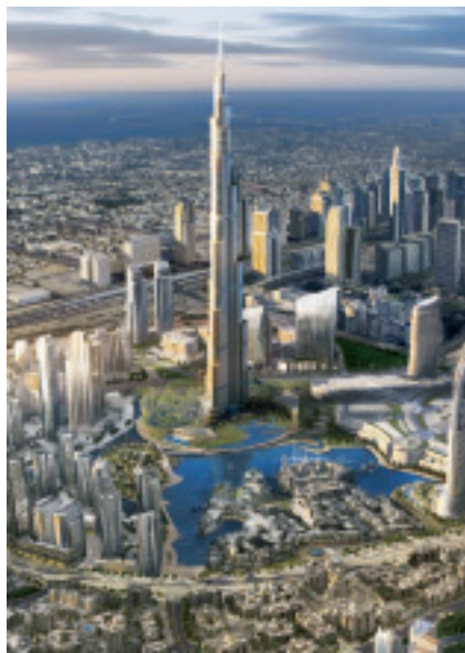
図 ブルジ・ドバイ完成予想図