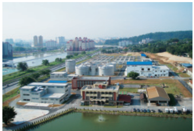
マレーシア5ヶ所の処理場中最大規模の 93,000 m^3 /日の能力を持つPantai STP

一方、浄化槽汚泥を集中処理する汚泥処理場では、脱水ろ液に含まれる高濃度の窒素を処理する為に固定化担体を用いた3段ステップ式硝化脱窒法（ペガサス）