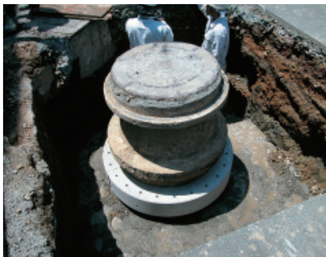
マンホールにコンクリートの部材を巻き付ける