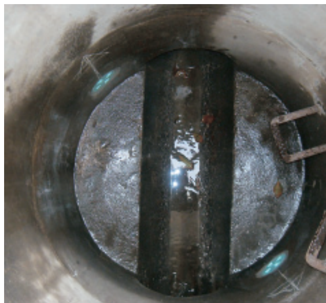
取り付けられた過剰間隙水圧消散弁