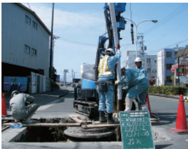
圧入されたケーシングに人工ドレーンを挿入

最後になりましたが、取材の際にお世話になりました浜松市上下水道部の皆様にご場をお借りして御礼申し上げます。