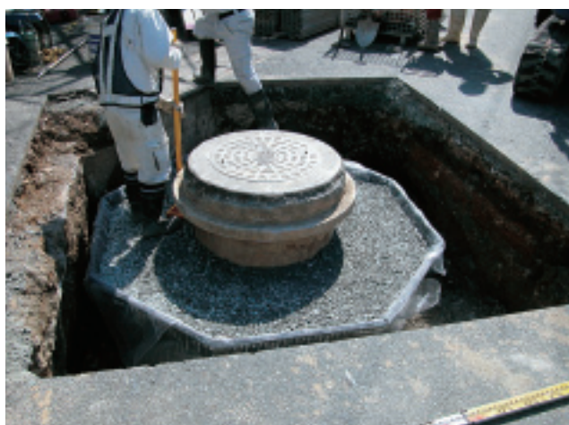
上部に金枠を取り付け、中に重量体を充填