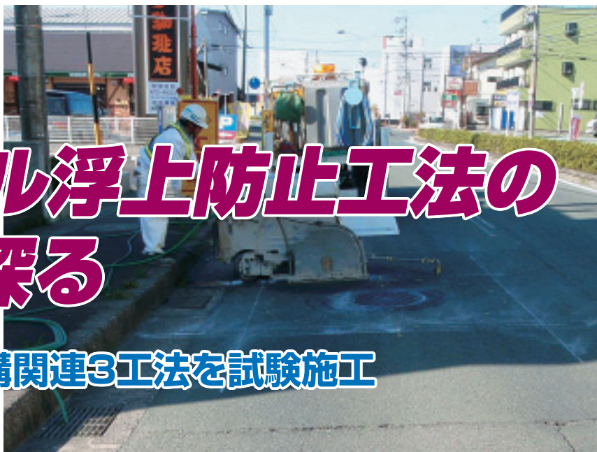
市内の幹線道路や避難路を対象に実証実験が行われている