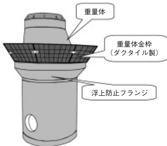
図-1 マンホールフランジ工法概要図