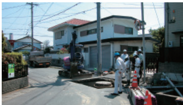
緊急避難場所となっている小学校裏手の道路での施工状況

そこで、今回のトピックスは、この実証実験の概要とそこから浮かび上がってきたそれぞれの工法のメリットや課題などについて浜松市上下水道部におうかがいすることにしました。