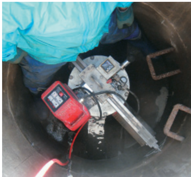
マンホールの直壁を中から穿孔

「土工事がないため、4工法の中ではもっとも施工性のいい技術と言えます。マンホール内に作業員が入って施工するだけですから、交通規制や騒音・振動が最小限に抑えられるという点からもメリットは大きいと思います。課題があるとすれば、地震発生後に、はずれた受圧板をどうやって復旧するのかということや、大型車両などによる振動で受圧板がはずれる可能性はないかということです。幹線道路や常時地下水の