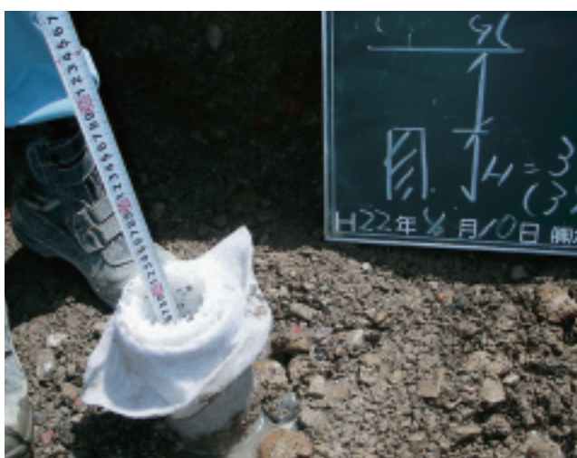
設置されたドレーン