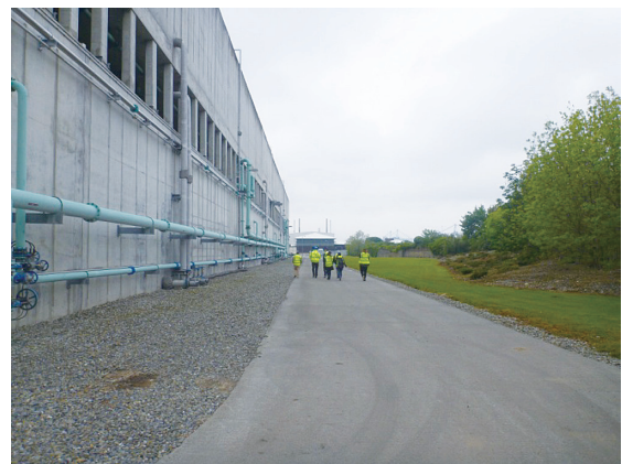
回分式活性汚泥法を用いた2階建ての処理施設