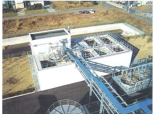
施設内から出る排水は、処理して再利用している

この施設での木質系バイオマス（建設廃木材、木くず、剪定枝等）の処理能力は年間4～5万t。燃料用エタノールの製造量は、今年度1,400klを予定していますが、将来的には設備をさらに増強し、年間4,000klの製造・出荷をめざしています。