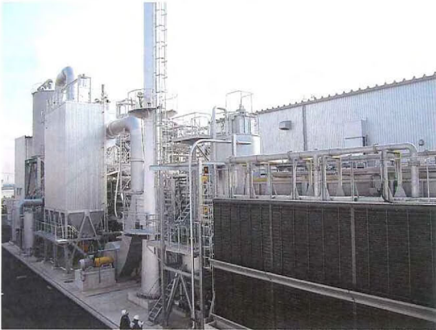
ボイラーによって施設内で使う蒸気と電力をつくり出す

縮・蒸留・脱水設備」でガソリンに添加できる濃度(99.5%)にまで濃縮され、製品エタノールとしてタンクに貯蔵されます。