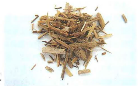
エタノール原料用チップ

タノール・ジャパン・関西(株)が取り組んだのは、木質系の原料からセルロースを糖化することによって、エタノールを製造するプラントの建設です。中核となる技術は、丸紅(株)と月島機械(株)がアメリカから導入しました。その技術を使用し、大成建設(株)、丸紅(株)、月島機械(株)3社で建設廃木材を原料とする実用化研究開発