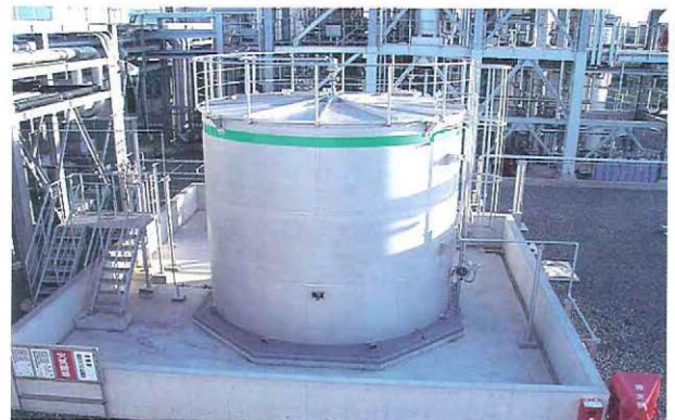
できたエタノールを貯蔵するエタノール製品タンク