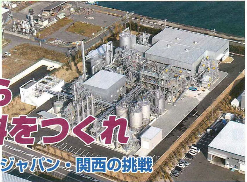
大阪湾に面した大阪エコタウンに建設されたバイオエタノール製造施設