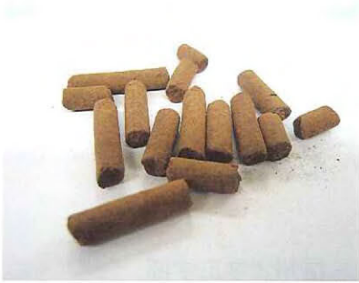
木材残渣を固めたリグニンペレット