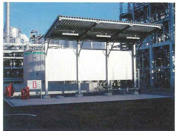
ここからタンクローリーに積み込んで出荷する