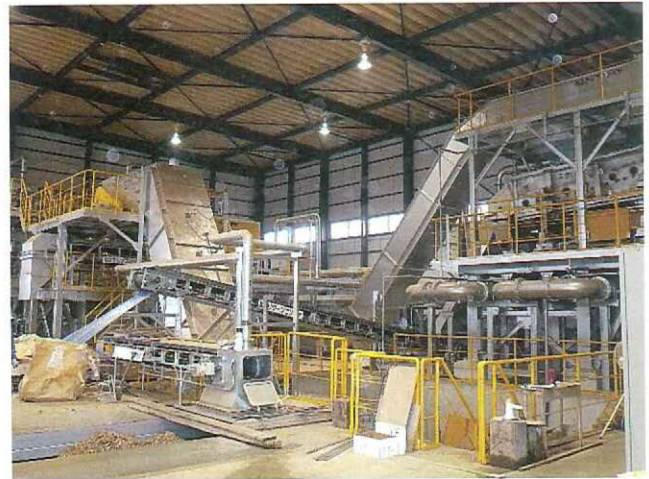
木材を破砕する前処理設備は日量180tを処理する

堺市のバイオエタノール製造事業の事業主体である大成建設(株)、大栄環境(株)など5社が出資するバイオエ