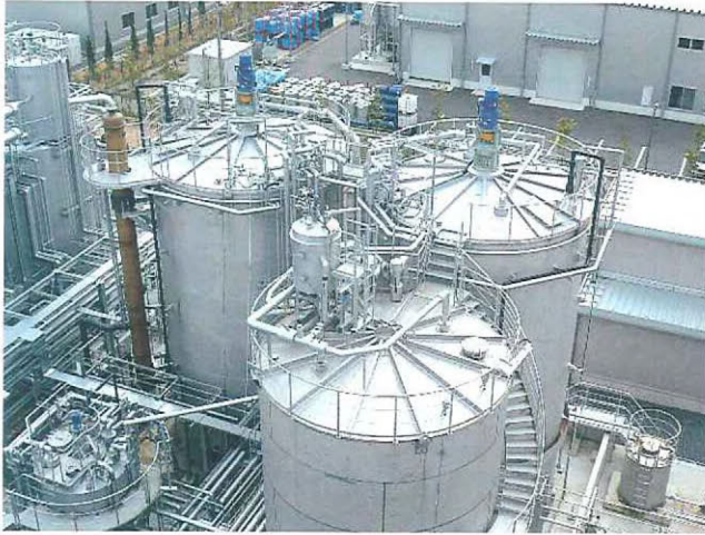
日量82tの処理能力がある発酵設備