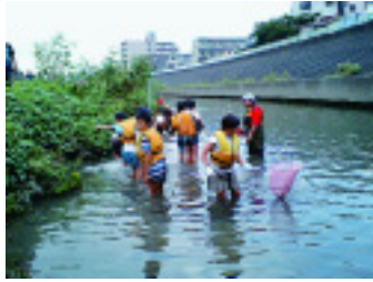
小学校の総合学習をサポートする河川学習支援