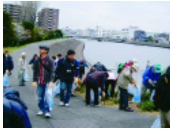
流域の市民・企業・行政と協働によるクリーンアップ