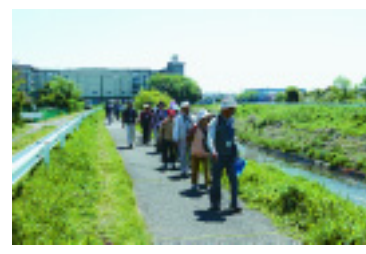
川沿いを歩きながら学ぶウォーキング