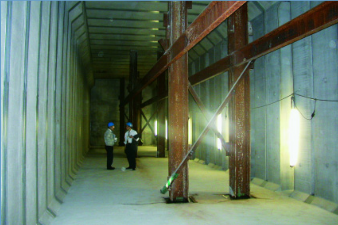
完成間近のプレキャスト式雨水調整池

日比谷公園と皇居のお濠にはさまれた日比谷交差点付近は、地形的に道路上に降った雨が交差点付近に集まりやすいため、過去に数度の道路冠水等の浸水被害が発生していました。そのため、東京都下水道局では国土交通省と連携し、国土交通省が日比谷共同溝工事のために使用していた路下作業ヤードを活用して雨水調整池を建設することを計画、昨年度末に工事が完了しています。その雨水調整池の築造に下水道機構と民間企業が共同で研究開発した「プレキャスト式雨水地下貯留施設」の技術が採用されています。