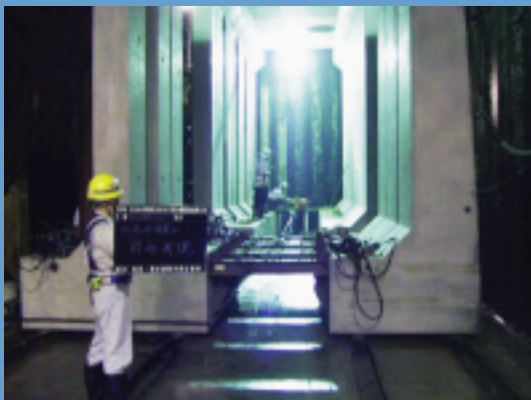
③スライド移動させて据え付ける