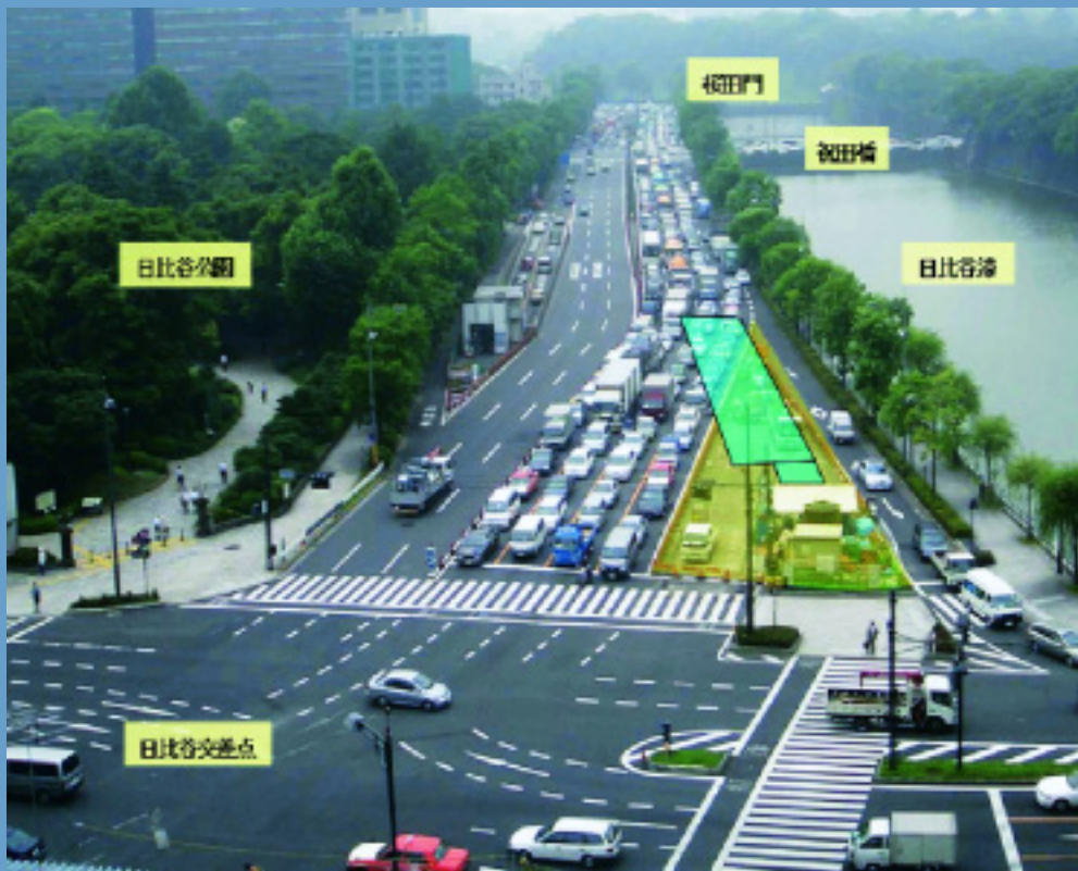
雨水調整池（四角い印）が築造されている日比谷交差点付近