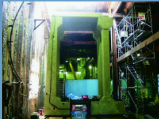
②ヤード内で仮組み