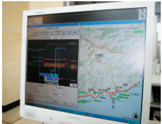
ポンプフロー図でそれぞれのポンプの状態を詳細に表示できる

や、事故発生時の当該ポンプ所内の状況および同系統各ポンプ所への影響などの情報がリアルタイムに把握できることです。大手ポンプ場に設置した遠隔監視制御装置から緊急時の処理対応が的確かつ迅速にできるため、かなりの省力化と業務の効率化、コスト縮減が図れました。