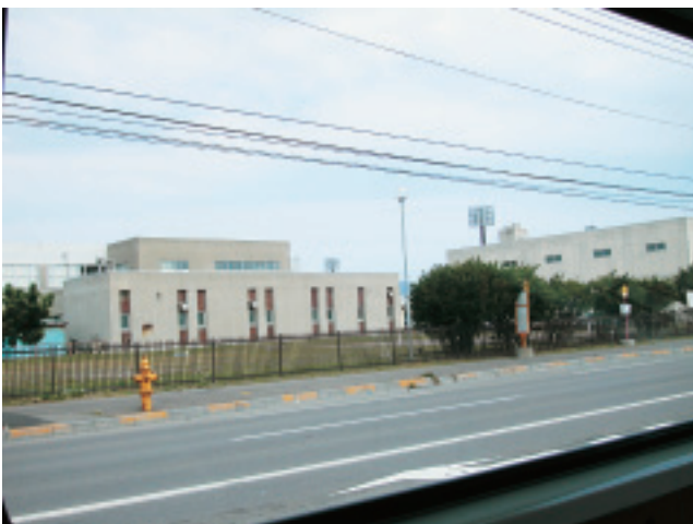
81,200m 3 の処理能力を持つ南部下水終末処理場