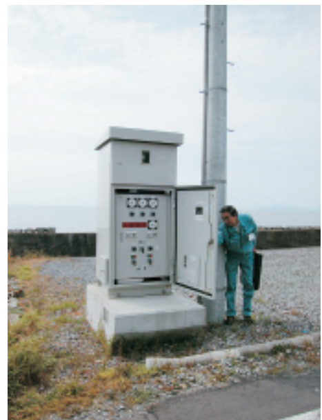
制御盤のすぐ後ろに海岸が迫る