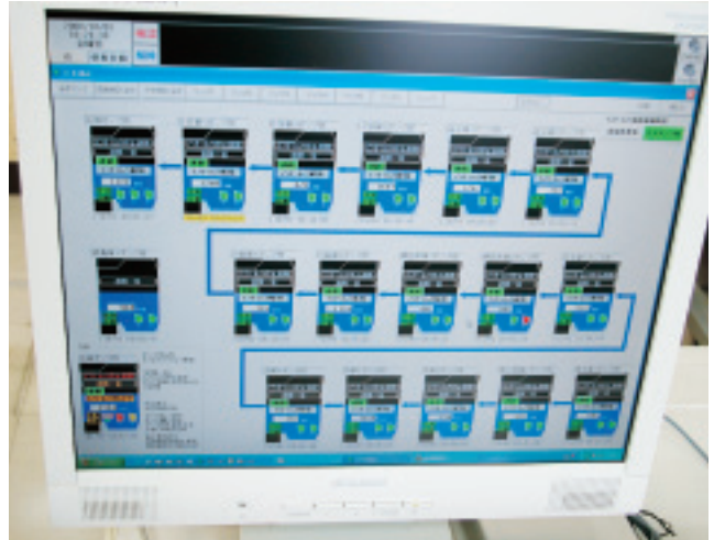
系列フローで全体の運転状況を監視