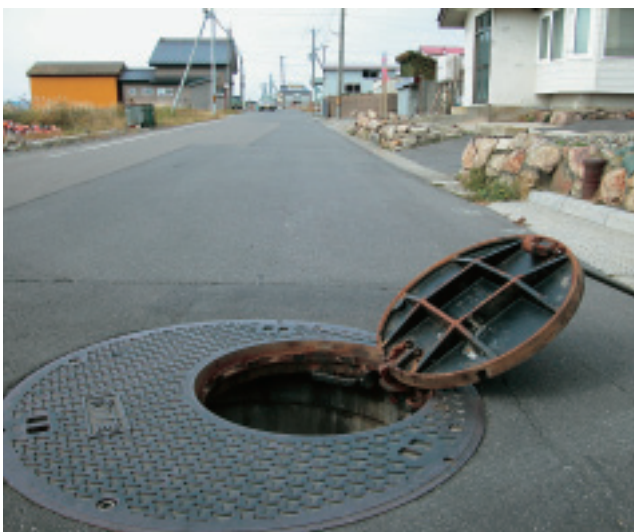
戸井地区の海岸線を走る道路下に設置された マンホールポンプ（小安第一ポンプ所）

導入されているのか、また、どのようなメリットをもたらしているのかを函館市水道局の方々にお聞きしました。