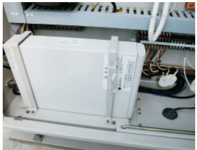
停電などの非常時に一定時間電源を供給する 無停電電源装置UPS