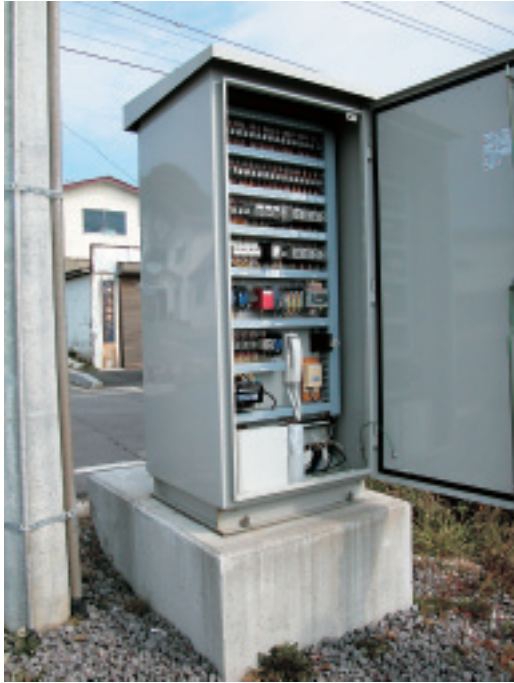
ポンプ制御盤の内部