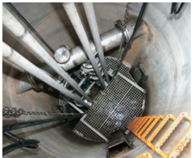
小安第一ポンプ所（吐出量 2.154\text{m}^3/\text{min} ）の内部の状況