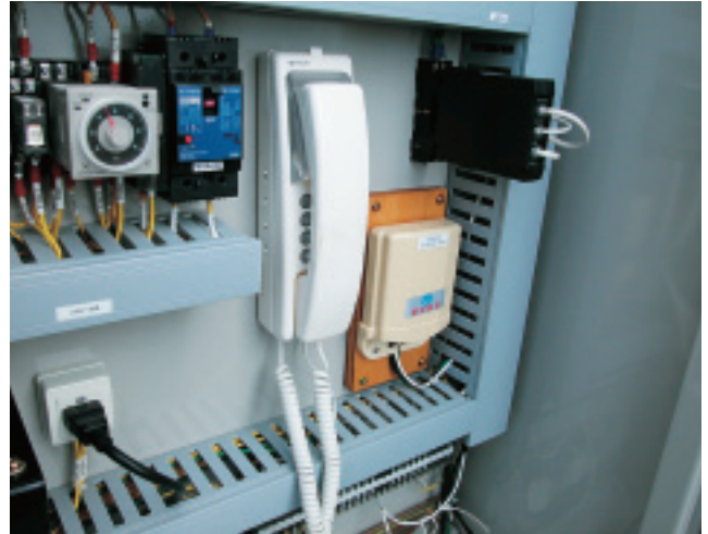
コントロールルームと直接会話ができる受話器も設置