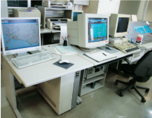
大手ポンプ場のコントロールルーム（中央監視制御室）