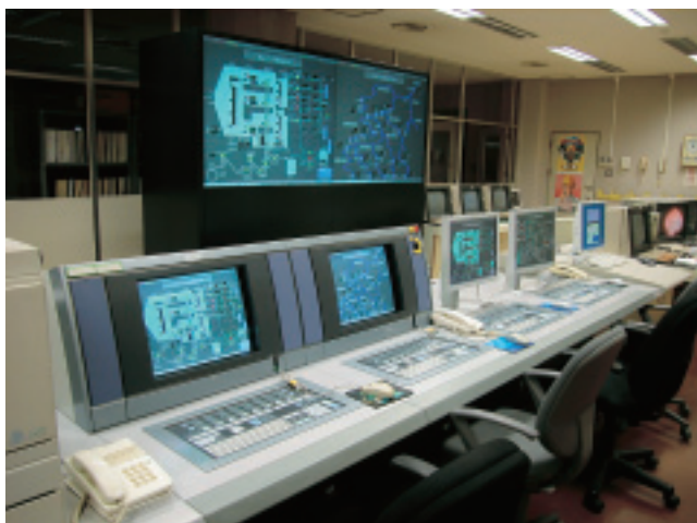
二上浄化センターのコントロールルーム