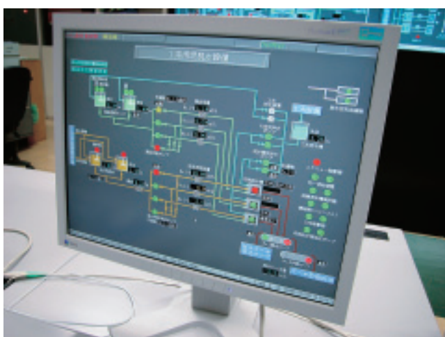
パネルには、スクリープレスの稼働状況が赤く示されている