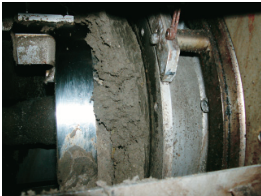
プレッサーの隙間から押し出された脱水ケーキは含水率79%以下に

また、ベルトプレスのようにサイドリークを起こさないことも長所です。多少汚泥の性状が変化しても、