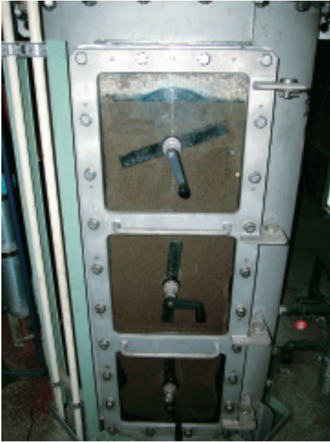
投入前に高分子凝集剤を添加してフロックを形成