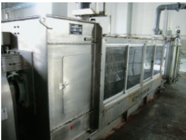
小矢部川流域下水道・二上浄化センターに導入された 圧入式スクリーブプレス脱水機

そこで、下水道機構では、これらの課題に対応するため、プラントメーカー6社との共同研究によって、汚泥を連続して安定的に脱水する圧入式スクリーブプレス脱水機の開発に取り組みました。