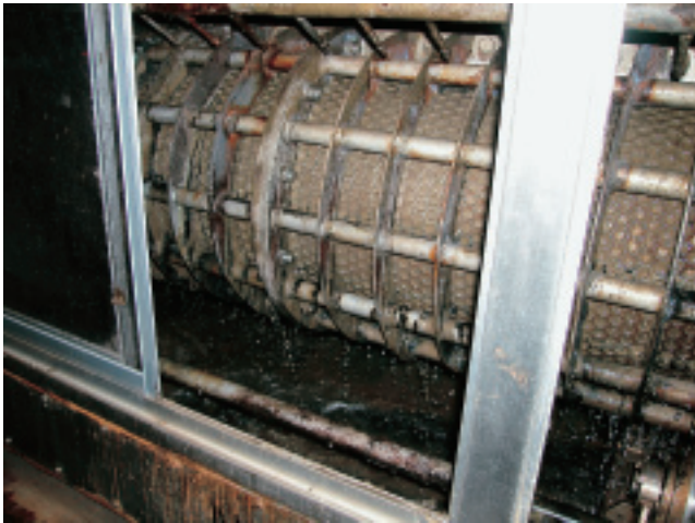
ろ過ゾーン（孔径1.0mm）と圧縮ゾーン（孔径0.5mm） を経て汚泥から水分が圧搾される

ろ過速度は、定格で1時間当たり305kg-ds、脱水ケーキの含水率は79%以下となっています。ゆっくりと汚泥を脱水していくので駆動エネルギーが小さく、騒音や振動もほとんどありませんし、構造がシンプルなのでメンテナンス性にも優れています。また、機器全体をガラス窓のついたカバーで覆うことで、洗浄水の飛散や臭気の拡散を防止するなど環境面の配慮も行われています。