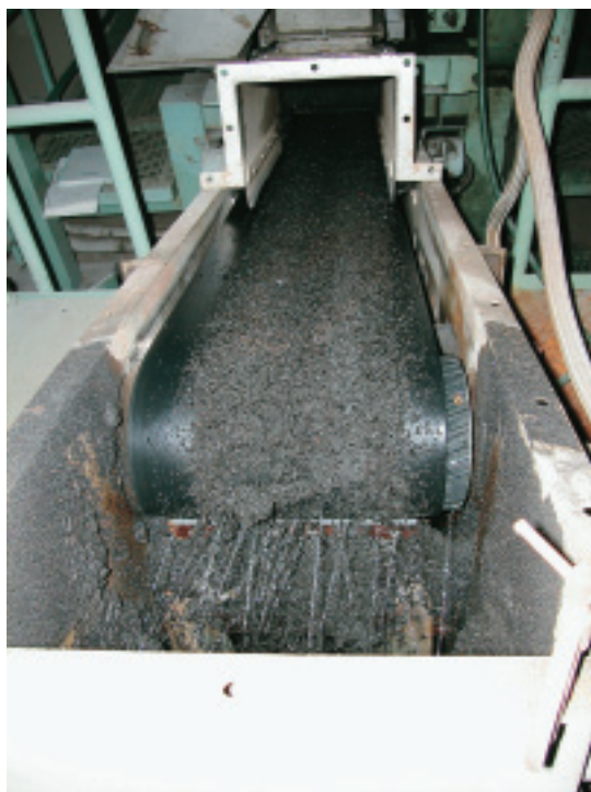
脱水された汚泥は溶融されてスラグとなり、再利用されている

また、これは今後の技術開発への期待ということになるとは思いますが、シーケンサを組み込むなど、含水率を手元で簡単に制御できるようなシステムが出てくれば、更に脱水機の運転管理は向上すると考えていますので、今後の研究開発に期待したいと思います。