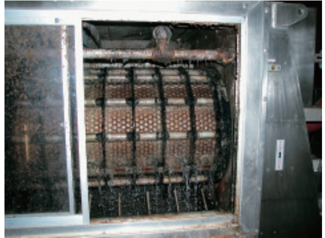
濃縮ゾーン（孔径1.5mm）からは大量のろ過水が