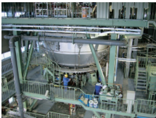
平成18年から稼働している新型溶融炉

スクリープレス脱水機は、安定した汚泥脱水性能や維持管理のしやすさから、すでに100台以上が全国の下水道処理場で採用されています。下水道機構では、スクリープレス脱水機の更なる脱水性能の向上や効率的な運転管理に関する共同研究を企業とともに進めてきました。また、新たな発想から生み出された新型脱水機の研究開発にも着手しています。今回取材させていただいたご意見を参考にし、次の技術開発につなげていきたいと思っています。貴重なお話をありがとうございました。