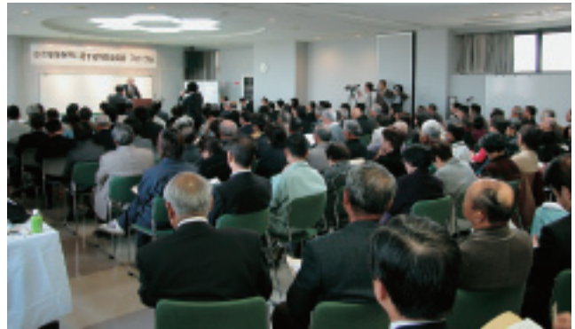
フォーラム会場には地元住民ら180名が集まった

される会場へ移動しました。そこでは既に地元住民ら約180名が集まり、フォーラムの開始を待っていました。会場はほぼ満員の状態で、多度津町住民の水への関心の高さがうかがえました。