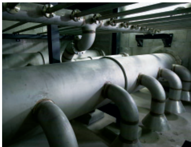
洗浄排水を集める高速洗浄装置の集水部