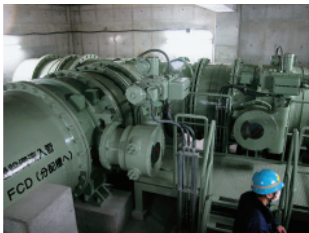
流入水の切り替えを行うバルブ

また、導入に際しては、既設の第一沈殿池を改造してシステムを組み込むことで建設費の縮減と工期短縮を図ることができましたし、ランニングコストも揚水ポンプと洗浄排水ポンプの電気代のみですので、導入後のコスト縮減にも大きく貢献する技術だと感じています。