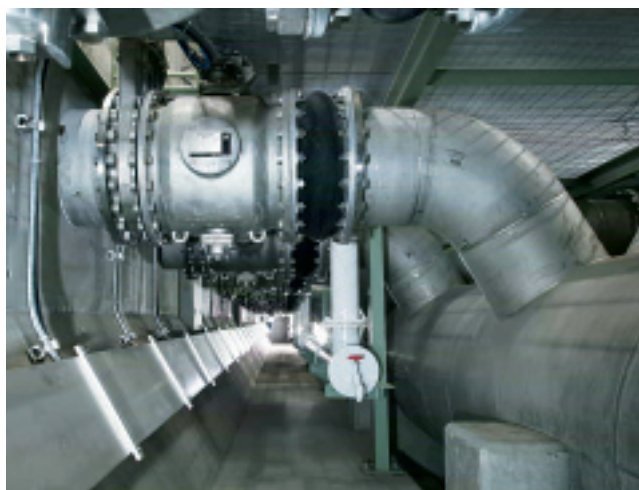
高速洗浄装置の開閉部

働している雨天時高速下水処理システムの運転状況を東京都下水道局流域下水道本部の方々にお聞きすることになりました。