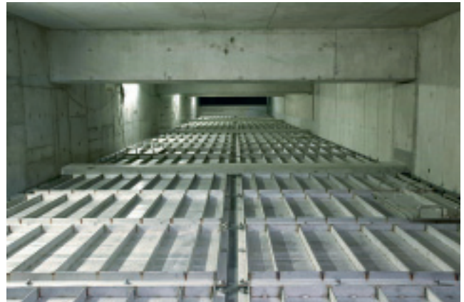
ろ過池の上部スクリーン。この下にろ材が入っている

このシステムの処理能力は、計画水量で日量12万7,700m 3 、ろ過速度725.6m／日（最大1,000m／日）です。手裏剣のような特殊形状をした浮上ろ材によって未処理下水の簡易処理を行うもので、凝集剤を用い