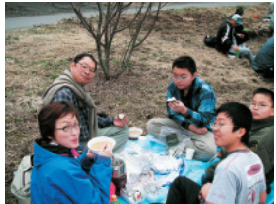
楽しみはやっぱりお昼のお弁当