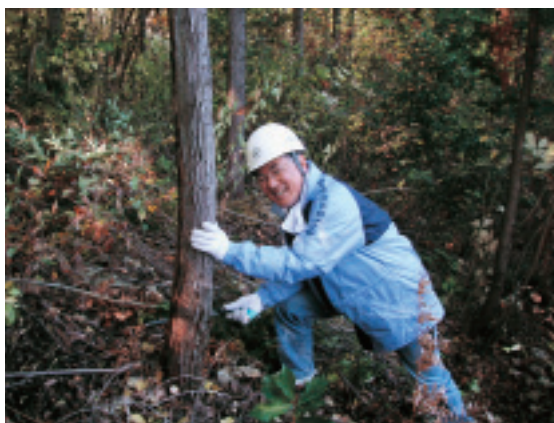
何時まで続くかこの笑顔

ます。流域に住む人たちも水の恵や森林の役割について理解を深め森づくりに協力します。水源の森において、下草刈り，枝打ち，除伐，間伐などの作業を下流域の住民達が水源地の人々と協力して行います。