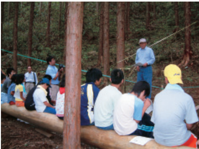
グリーンスクール事業に参加する子供たち

森づくりはたくさんの時間と労力を要する壮大な挑戦です。樹木の育成環境や光環境を改善する下草刈り、除伐、間伐などの作業は多くの人手を必要としますが過疎化と高齢化が進む山村の人手不足、資金不足は深刻です。何時までもきれいな水を豊かに活かし続けるために、恵みを受ける流域の人びとが、水源の地の人びとと協力して森づくりをする事が求められてい