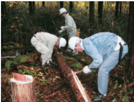
手鋸一丁で間伐，玉切りは難儀な作業